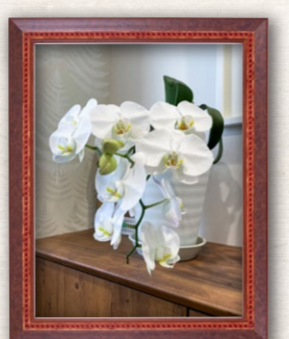
胡蝶蘭「開花」 「数年前に贈られた胡蝶蘭を咲かせました」 スタッフの皆さん (ウエリスオリーブ東村山富士見町)