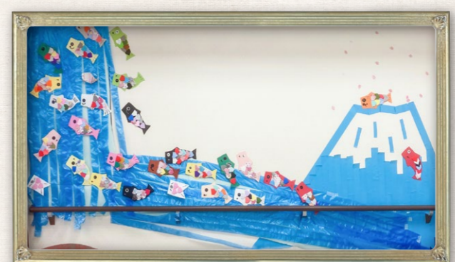
壁面装飾 「皆様で協力して装飾した作品です。それぞれに個性が出ています」 ケアレジデンスご入居の皆様(ウエリスオリーブ武蔵野関町)