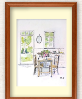
水彩スケッチ 「絵画サークルの皆様の最近の作品をご紹介します」 まちライブラリー スタッフ(ウエリスオリーブ成城学園前)