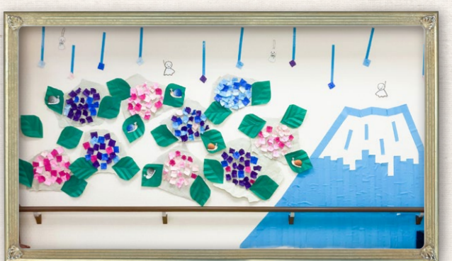
「皆様で協力して装飾した作品です。それぞれに個性が出ています」 ケアレジデンスご入居の皆様(ウエリスオリーブ武蔵野関町)