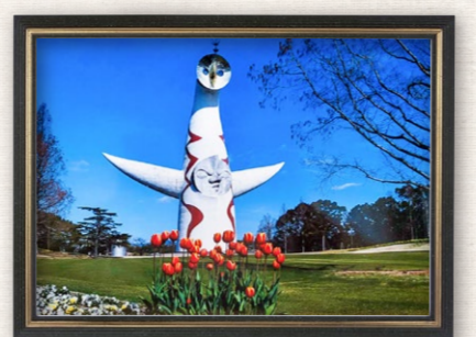
写真「早春」—太陽の塔 「コロナ前はよく万博公園へ行って写真を撮っていました。季節の花々と一緒に写すことを心掛けています」 笹倉猛さん (ウエリスオリーブ吹田千里丘)