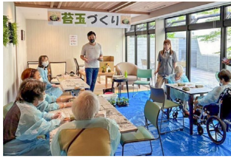
苜蓿づくり 7/21 手で土を丸めながら、「どろ団子作りを思い出すわ〜」と終始にこやかにしゃべりも楽しめました。