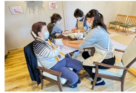
ハンドケアマッサージ 12/8 癒し効果もあるアロマオイルを用いたマッサージは、「ツルツルになって若返った」と大好評でした。