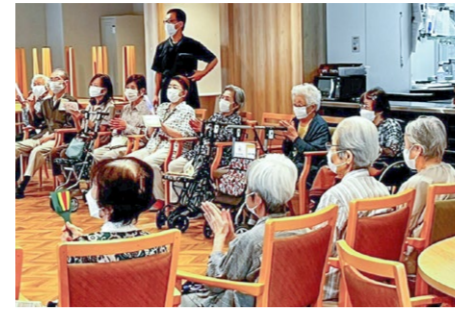
敬老会 9/17 スタッフによる天童よしみや尾崎紀世彦、ザビエルなどのモノマネ歌合戦に、みなさまが大爆笑！