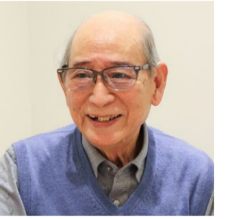
1937年生まれ、東京都出身。語学は若い頃に好きだった英語の歌で習得。愛車でドライブしながら町田の街探訪を日々楽しんでいます。

ご縁を大事にし今につながる人生 好きが高じて、プロ級に磨いたあらゆる技能を人のために発揮し、人と人、そして日本と世界をつなぐことができました。貢献の精神が、よいご縁を次々と呼び寄せています。