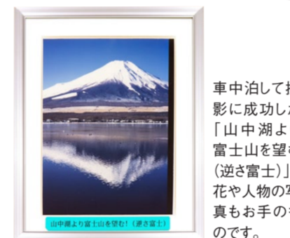
車中泊して撮影に成功した「山中湖より富士山を望む(逆さ富士)」。写真もお手のものです。

あなただけの物語、「自分史」を「オリーブ便り」に掲載しませんか？ 【オリーブ便り】編集スタッフがお話をうかがい、あなたの「自分史」の記事にとどめます。大切にしてきたことやもの、思い出話などをぜひお教えください。ご興味がありましたら、コンシェルジュスタッフまでお声掛けください。