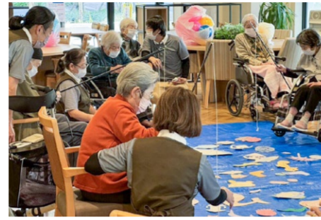
魚釣り大会 11/19 ブルーシート的大海に釣り糸を垂らして魚釣り！競い合い、童心に帰り、笑顔いっぱいの大漁でした。