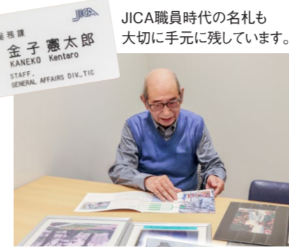
JICA職員時代の名札も大切に手元に残しています。