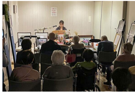
黄昏コンサート 11/12 作品展とのコラボ企画として、ピアノの生演奏コンサートを開催。まったりとお過ごしいただきました。