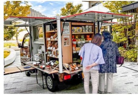
阪急デパ地下スイーツ販売 9/15 2回目の移動販売となった今回は、リクエストにお応えして和菓子が充実！とても喜ばれました。