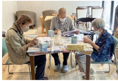
風鈴づくり 8/11 白地の風鈴に絵具やシールなどで絵付けを自由に創作。完成品を飾り付け、「風鈴まつり」も開催！