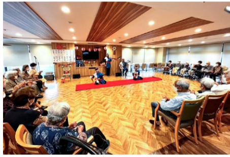
安来節 (鳥根県) 10/15 保存会のみなさまによる「どじょうすくい」「銭太鼓」など、希少な伝統芸を間近で観ていただきました。